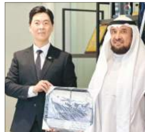
الحمدان مكرما السفير الكوري

والتي تشمل عدداً من الدول في أنحاء العالم، مؤكداً أهمية التبادل الطلابي لكونه يتيح الفرصة لزيادة التحصيل الأكاديمي، والتقريب بين الثقافتين العربية والعالمية، لبناء شراكات مع مؤسسات علمية حول العالم.