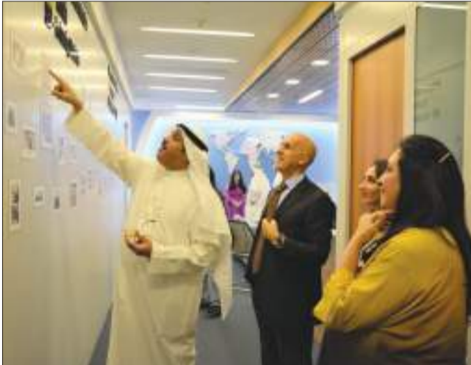
الوقيان وعدد من الأساتذة في جولة جانبية في المكتب