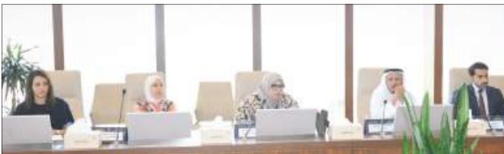
جانب آخر من الاجتماع