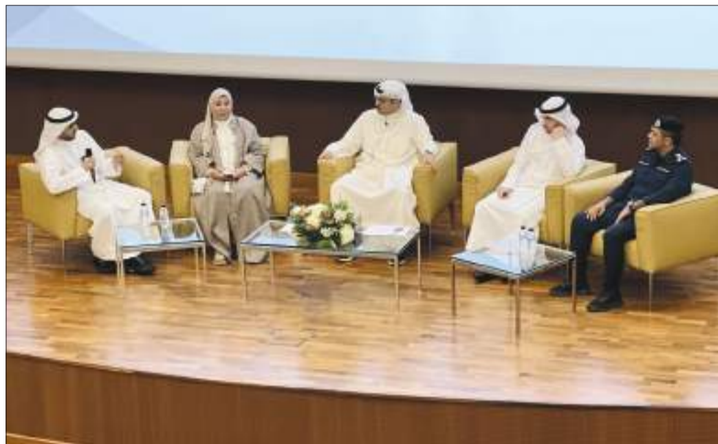
جانب من الحلقة النقاشية

العميد قبازرد: مكافحة المخدرات تقدم خدماتها للمواطنين والمقيمين على مدار الساعة عبر الخط الساخن 1884141