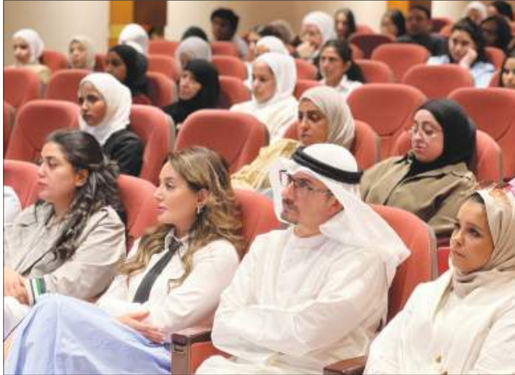
جانب من حضور اللقاء التنويري