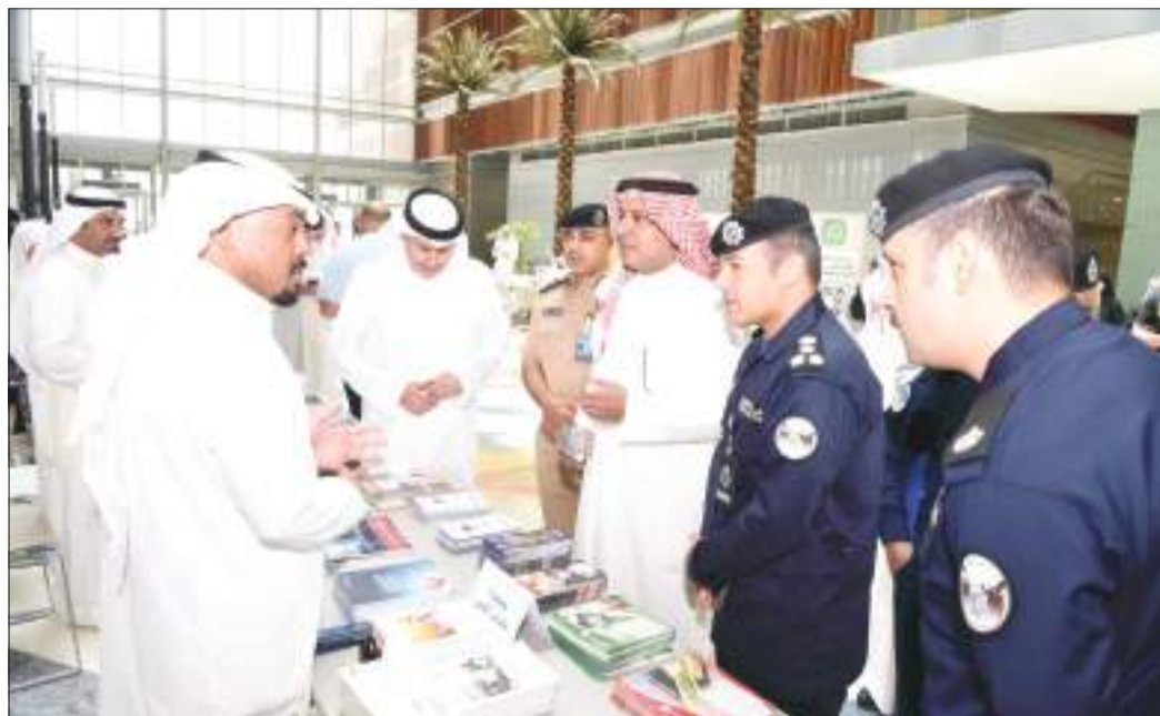
جولة في المعرض