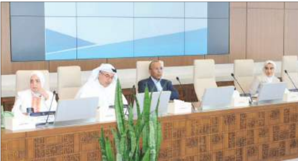
جانب آخر من اجتماع كلية الدراسات العليا

غير الكويتيين في القبول سنوياً بكلية الدراسات العليا، ومذكرة بشأن: سياسة الذكاء الاصطناعي التوليدي (GenAI) 2023/2024، مذكرة بشأن ميزانية مكتب الاستشارات والتدريب بكلية الدراسات العليا للعام المالي 2023/2024.