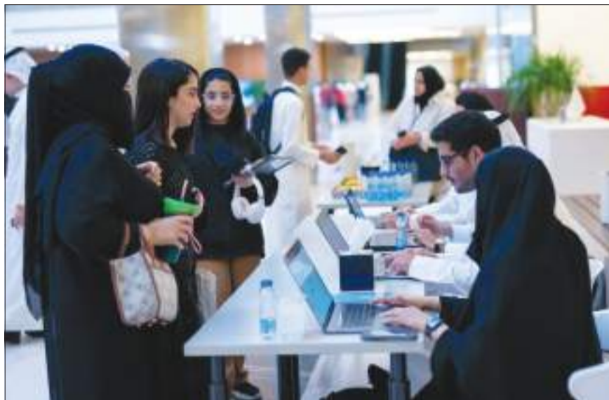
جانب من البرنامج التدريبي في الكلية

من منطلق المسؤولية الاجتماعية لكلية العلوم الإدارية وفي ضوء التعاون الإستراتيجي المشترك بين كلية العلوم الإدارية وأكاديمية كودد (الكويت تبرمج) لتنمية الموارد البشرية أطلقت الأكاديمية برنامجاً تدريبياً مجانياً لطلبة الصف التاسع والمرحلة الثانوية في الكلية، ضمن إطار الاهتمام بخلق قاعدة شبابية واعية في مجال التكنولوجيا والتقنية وعلم البيانات والمساهمة في انخراط الشباب الكويتي في المجال التكنولوجي وتقنية المعلومات والبرمجة.