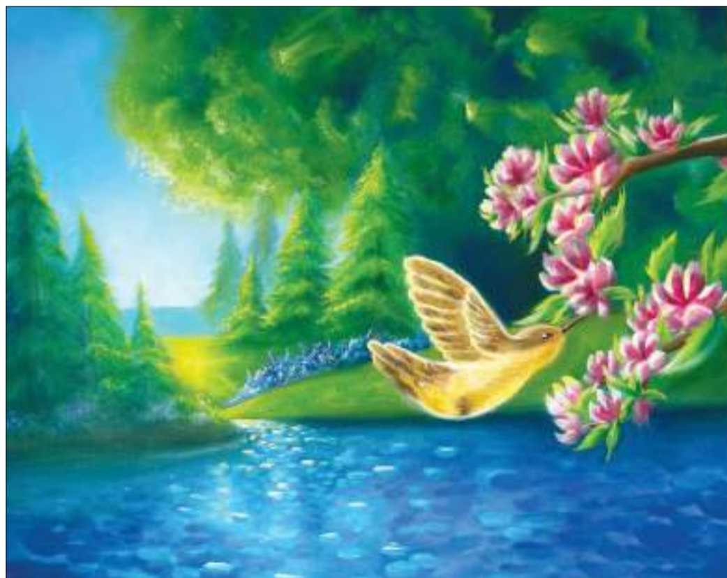
لوحة عن الطبيعة

وبالأخص تلك اللوحات التي تخص الطبيعة ومناظرها، كونها تبعث الراحة في نفسي ونفوس الغير. بالإضافة إلى حبي وتمكني من رسم البورترية، وهو فن رسم وجوه الأشخاص، وعلى الرغم من