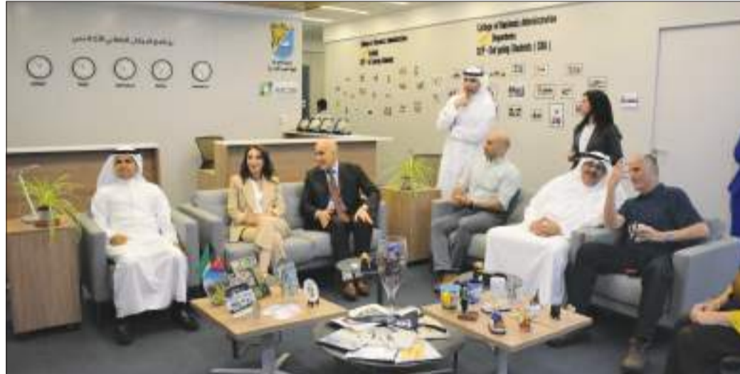
أسرة كلية العلوم الإدارية في جلسة حوارية أثناء افتتاح مكتب برنامج التبادل الطلابي الأكاديمي