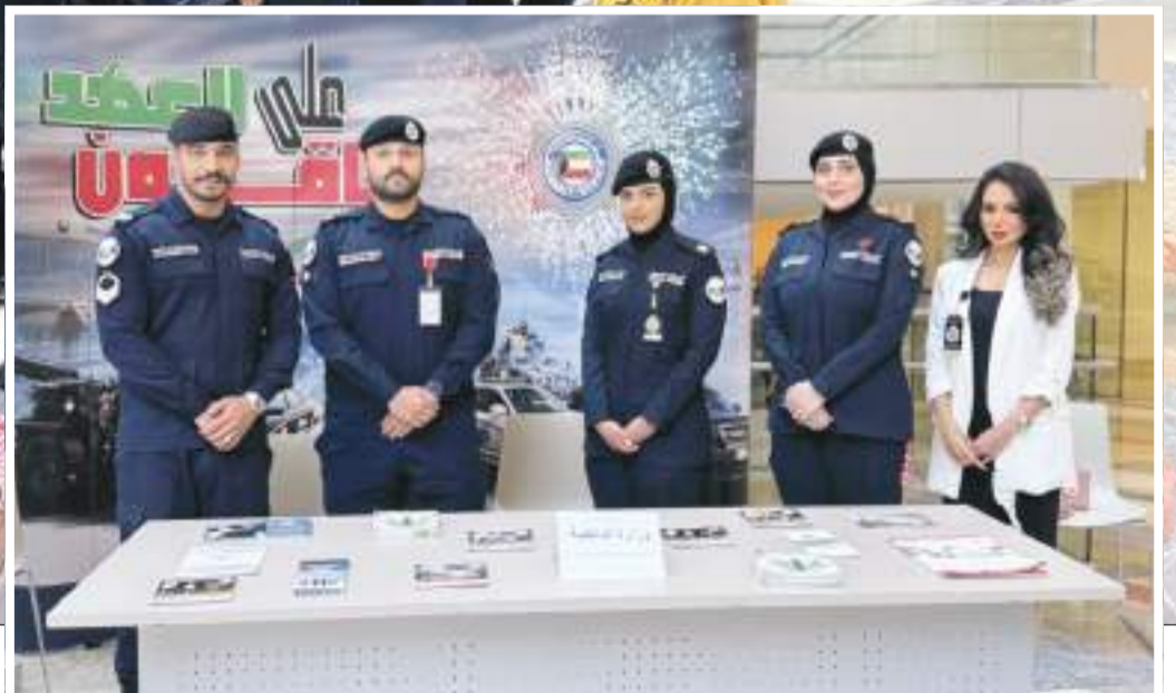
ممثلو وزارة الداخلية