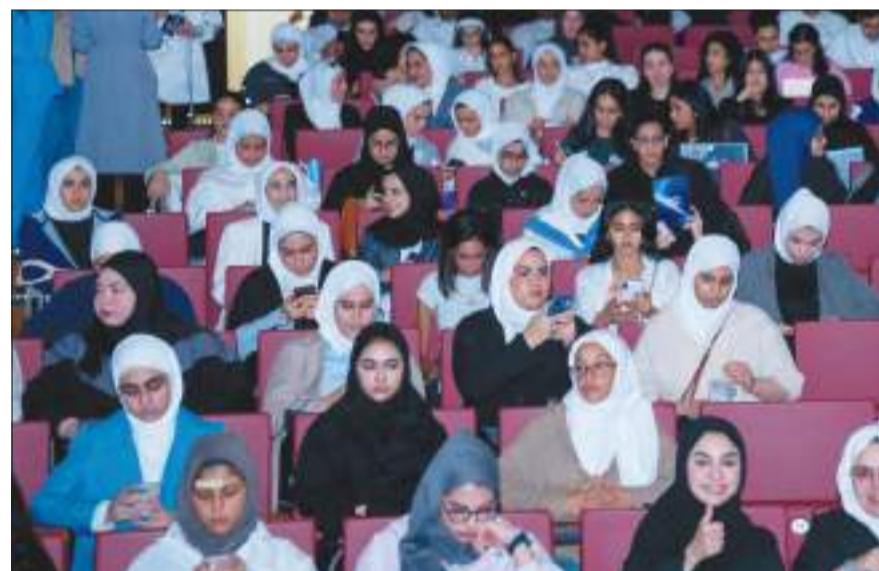
جانب من حضور الطالبات