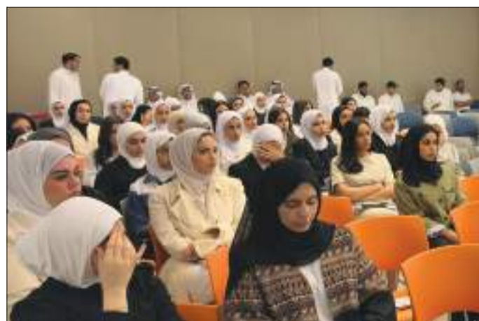
جانب من الجمهور

ويوجد بها أكثر من 70 موظفًا وكل موظف لديه مهام خاصة به، لافتاً إلى أن البداية كانت صعبة خصوصاً في عملية اختيار الموظفين لأنهم هم من يمثلون