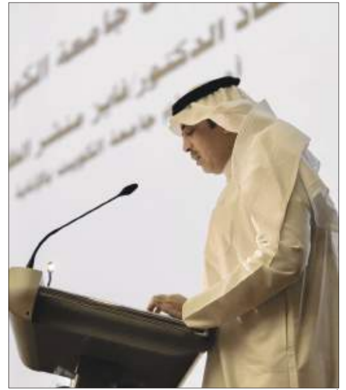
أ.د. فايز الظفيري يتحدث

والذي يشكلون أعمدة هذا الوطن ومستقبله، مؤكداً مساهمة جامعة الكويت في مثل هذه القضايا ينم عن المسؤولية الاجتماعية ودور أساسي لها لا يقل أهمية عن التعليم والبحث العلمي.