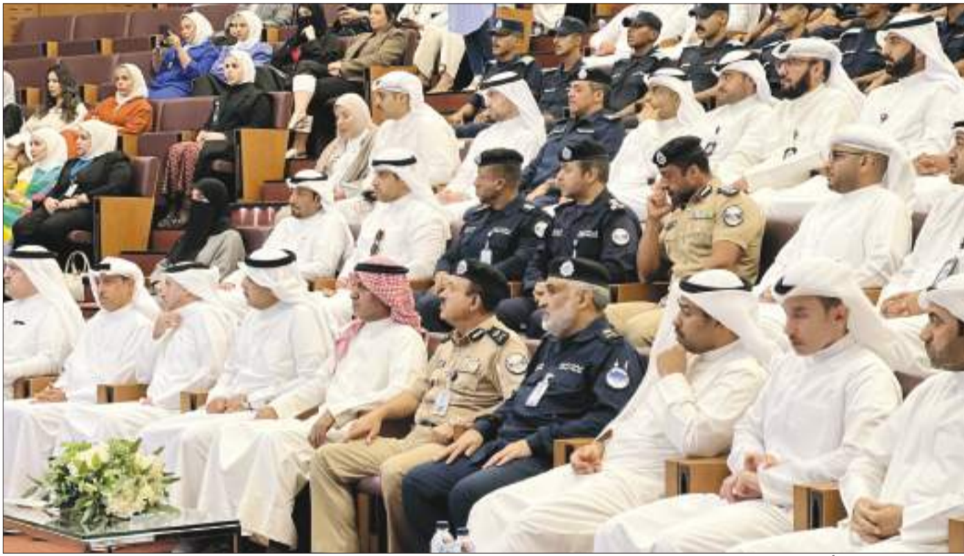
كبار قيادات الداخلية وأساتذة الجامعة يتقدمون الحضور