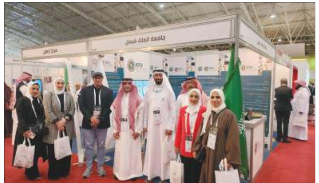
رئيس الوفد وأهل العبيد متوسطاً وفد الجامعة المشارك في المعرض