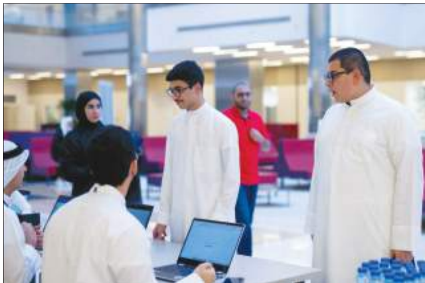
جانب آخر من البرنامج التدريبي