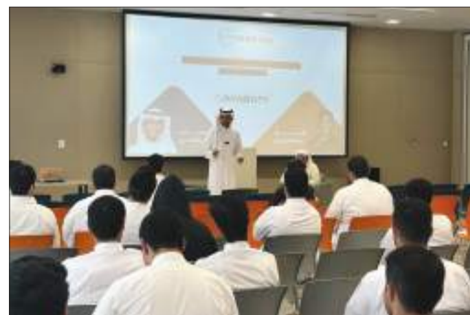
جانب من الجلسة الحوارية

والخطوات المدروسة. وتابع حديثه عن كيفية التوفيق بين الحياة والوقت وبين الإشراف على العمل بالشركة والحياة الخاصة، مشيراً إلى أن شركته