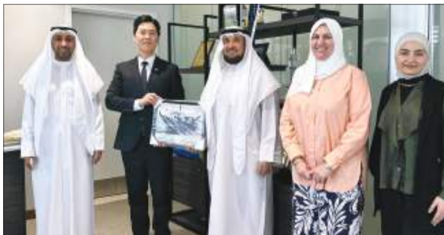
السفير الكوري يتوسط أسرة عمادة شؤون الطلبة