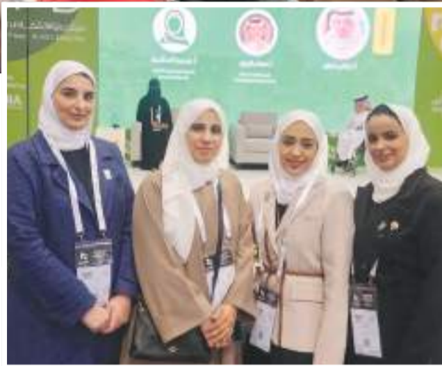
عضوات وفد الجامعة في لقطة جماعية أثناء مشاركتهن في المعرض

للأشخاص من فئة ذوي الإعاقة لدعم استقلاليتهم ومشاركتهم في مختلف المهام والأنشطة في مجالات الحياة مثل التعليم والتوظيف والمجتمع. وتضمنت الزيارة حضور الجلسات الحوارية، وتبادل الخبرات مع الأطراف المشاركة في المعرض، كما تم تجربة بعض الأجهزة من قبل أعضاء الوفد.