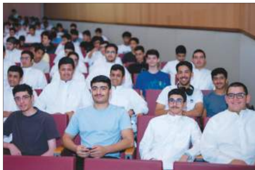
جانب من حضور الطلبة

الفضلي: المبادرة لها دور في تطوير مهارات الطلبة لتعليمهم البرمجة بطريقة ممتعة واحترافية