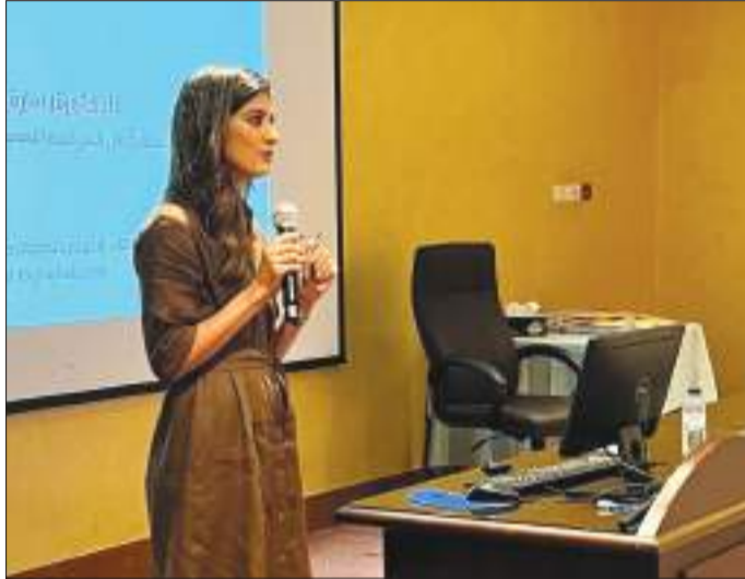
جانب من اللقاء التنويري